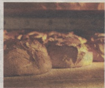
Die Bäckerei Bathelt verzichtet auf Prinzip auf künstliche Zusatzstoffe!

der Schweiz messen. Bewertet wurden diese qualitativ höchstwertigen Einsendungen von international anerkannten Jurorinnen und Juroren. Unterstützt wurde das 33-köpfige Juryteam vom Alt-Präsident des europäischen Bäcker- und Konditorenverbandes, Henri Wagener, sowie vom Hofbäcker und Hofkonditor des Schwedischen Königshauses, Günther Koerffer.